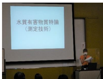
【水質有害物質特論】