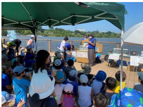
魚に関するクイズ