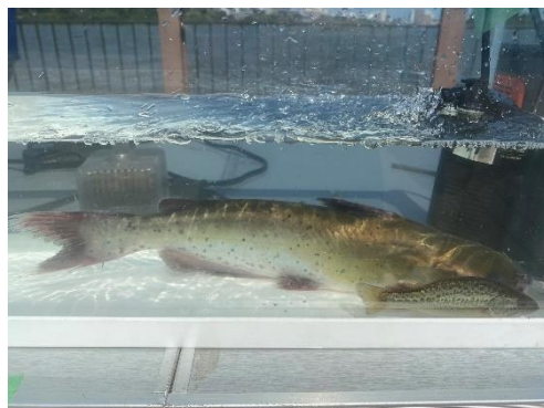
採取されたアメリカナマズ

子どもたちが採ってきた魚については、数種類をピックアップして水槽に入れ、皆で観察しました。採れた魚の生態等について講師から説明があり、そのほかにクイズ形式で子どもたちに質問をし、魚の外来種についての学習も行いました。