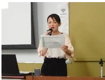
【水質有害物質特論】