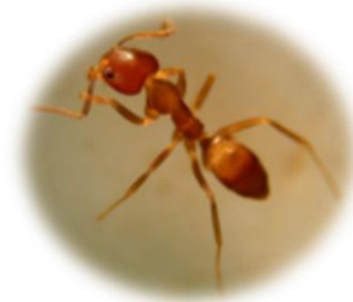
「アルゼンチンアリ」

グローバル経済の加速に伴い、人間が意図的に導入する外来生物だけでなく、移送物資に紛れて侵入してくる「非意図的外来生物」も増加を続けています。日本は資源輸入大国ゆえ、外来アリ類のような非意図的外来生物の侵入リスクは極めて高い国となります。実際に南米原産のアルゼンチンアリやオーストラリア原産のセアカゴケグモなど、1990年代以降、侵略的な非意図的外来生物の侵入・定着が繰り返されています。