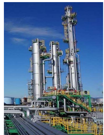
「苫小牧 CCS 実証試験機」

CCS とは火力発電や工場などで排出される CO 2 （Carbon dioxide）を、大気中に放散する前に捕えて（Capture）、地中の奥深くに貯蓄する（and Storage）技術の略称です。削減しきれない CO 2 を地中に埋める CCS は、カーボンニュートラルの実現に不可欠な技術であります。CO 2 を地中に貯蓄するためには、貯蓄層とその上部を覆う遮へい層が対になった地層構造が必要です。遮へい層は貯留槽に入れた CO 2 が漏れ出さないようフタの役割を果たします。CCS の全体のシステムは発電者や化学工場などの CO 2 の排出源から、様々な機械により CO 2 を分離・回収し、パイプラインなどで輸送、地中へと圧入・貯蓄します。