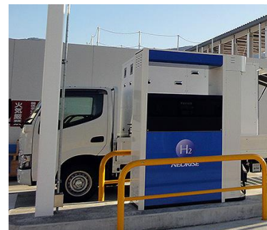
「山梨大学水素実証プラント」

山梨大学では1978年に文部省が「燃料電池実験施設」を設置。以降、研究・教育の両面を支援してまいりました。2008年に経済省事業として「燃料電池ナノ材料研究センター」を山梨県の全面的な支援を得て設立し、世界的に最大かつ最高レベルの燃料電池材料研究拠点としています。特徴ある設備としては、触媒や電解質膜の合成、触媒塗布膜の作成、各種セルの組み立てと性能・耐久等を最先端の計測器や顕微鏡によって評価ができます。